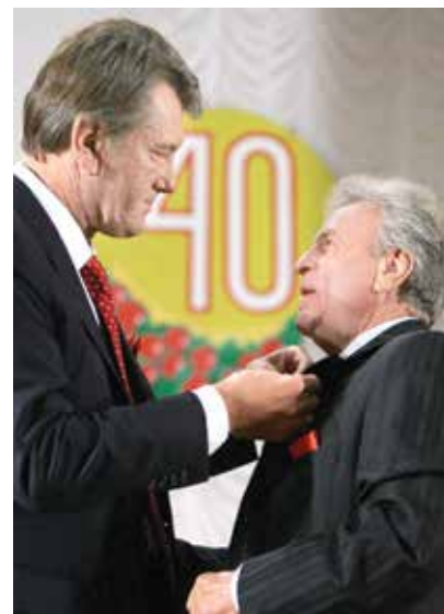
На світліні - Орден Ярослава Мудрого V ступеня Леоніду Канищенку вручив Віктор Ющенко

Радію, що славні навчальні, наукові, культурні і спортивні традиції, закладені нами 55 років тому, живуть і примножуються тепер уже такою великою університетською родиною. З роси і з води тобі, класичний університет Тернопоя!