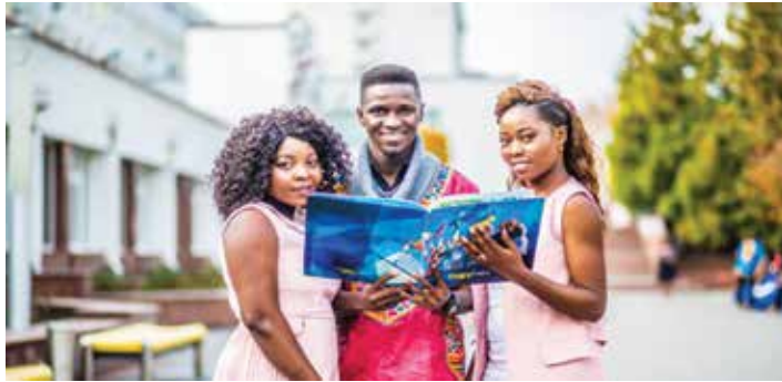
(Закінчення. Початок на 30-й стор.)

- Наталіє Іванівно, чи є серед студентів-мешканців гуртожитків Західноукраїнського національного університету особи, які мають право на отримання пільги за проживання у гуртожитку?