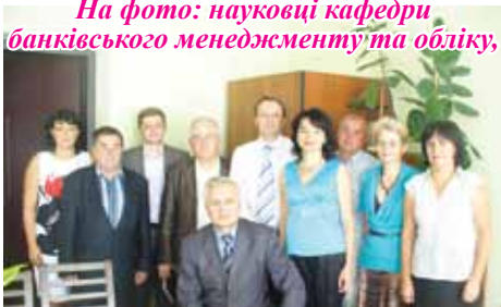
На фото: науковці кафедри банківського менеджменту та обліку,