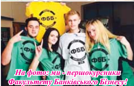
На фото: ми – першокурсники Факультету Банківського Бізнесу!

Нещодавно на факультеті банківського бізнесу відбулось потрібне свято – День факультету, День банківського працівника та остання пара випускників-їтикурсників.