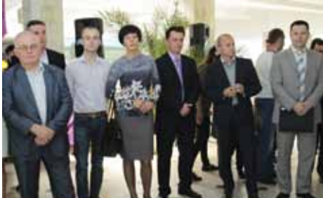
На фото: за мить до початку ярмарку «Тепло весни – для кожного»!