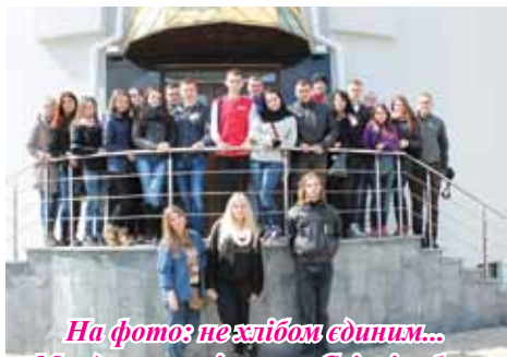
На фото: нехлібом єдиним... Мандруючи, пізнаємо Світ і себе...