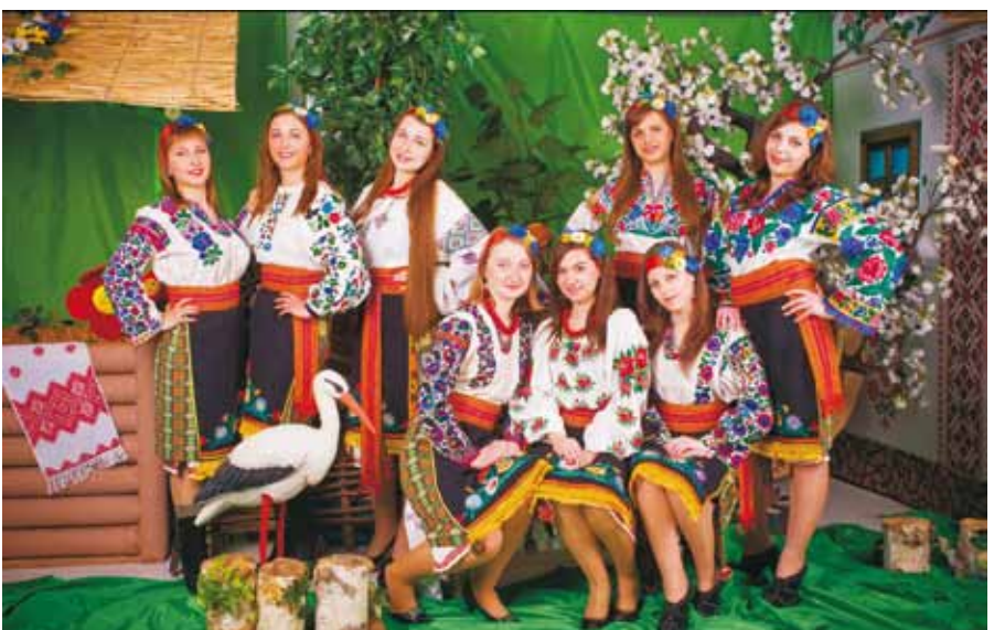
На світлині: Усміхненим студенткам так личить вишиванка, що служить оберегом для душі!