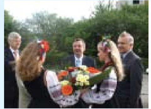
гість ТНЕУ — Надзвичайний і Повноважний Посол ФРН в Україні Ганс-Юрген Гаймзют (детальніше — на 4 стор.)