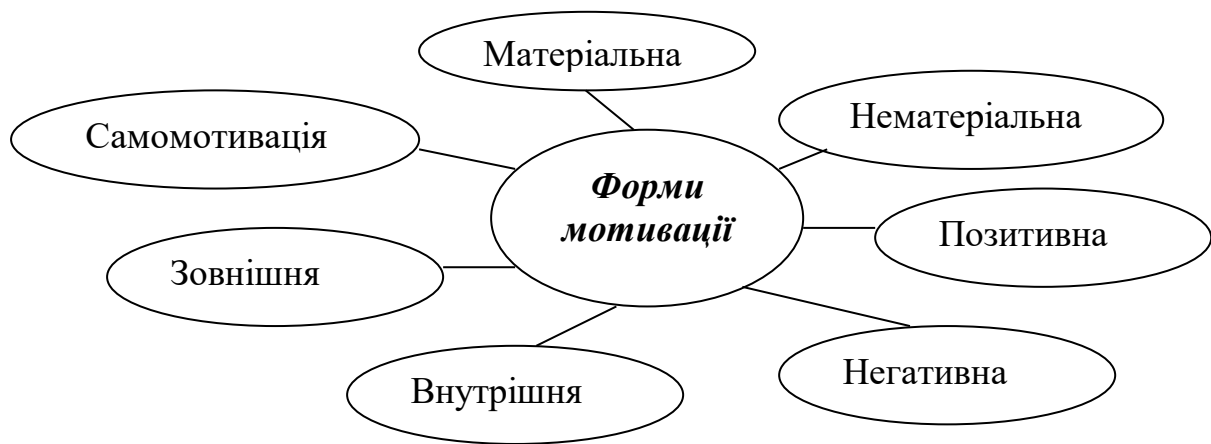
Рис. 1.1 Форми мотивації персоналу

Примітка: Сформовано автором на основі проведених досліджень