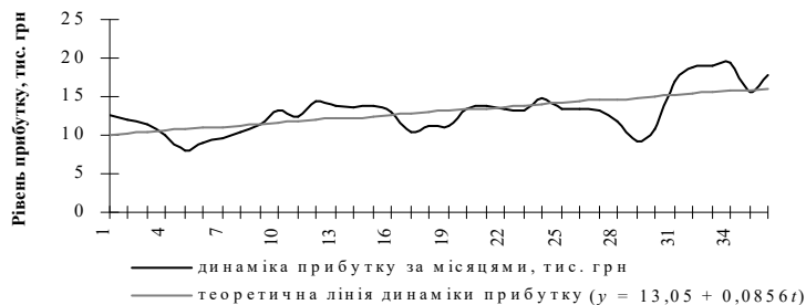
Рис. 4. Фактичні та теоретичні рівні динаміки прибутку підприємства «Ортопедія» за період у три роки